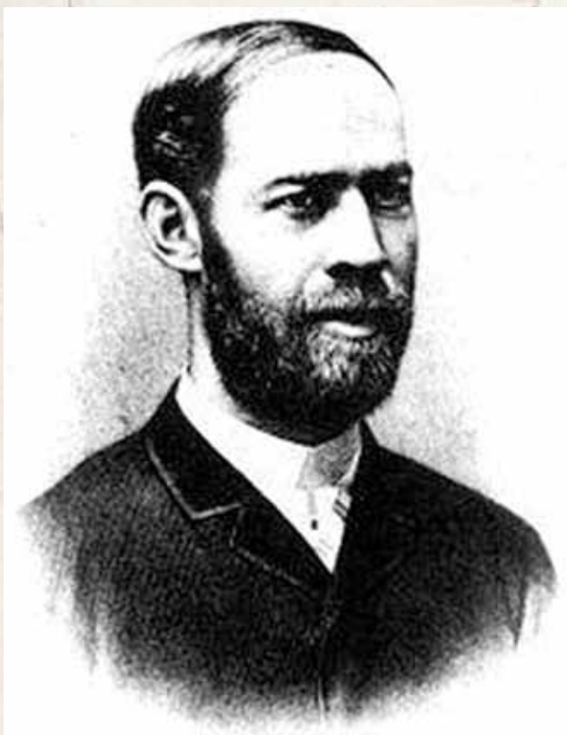
Heinrich Rudolf Hertz